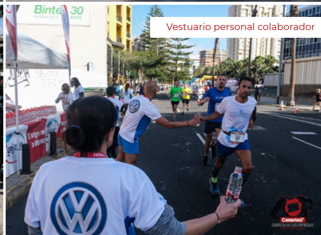
Vestuario personal colaborador