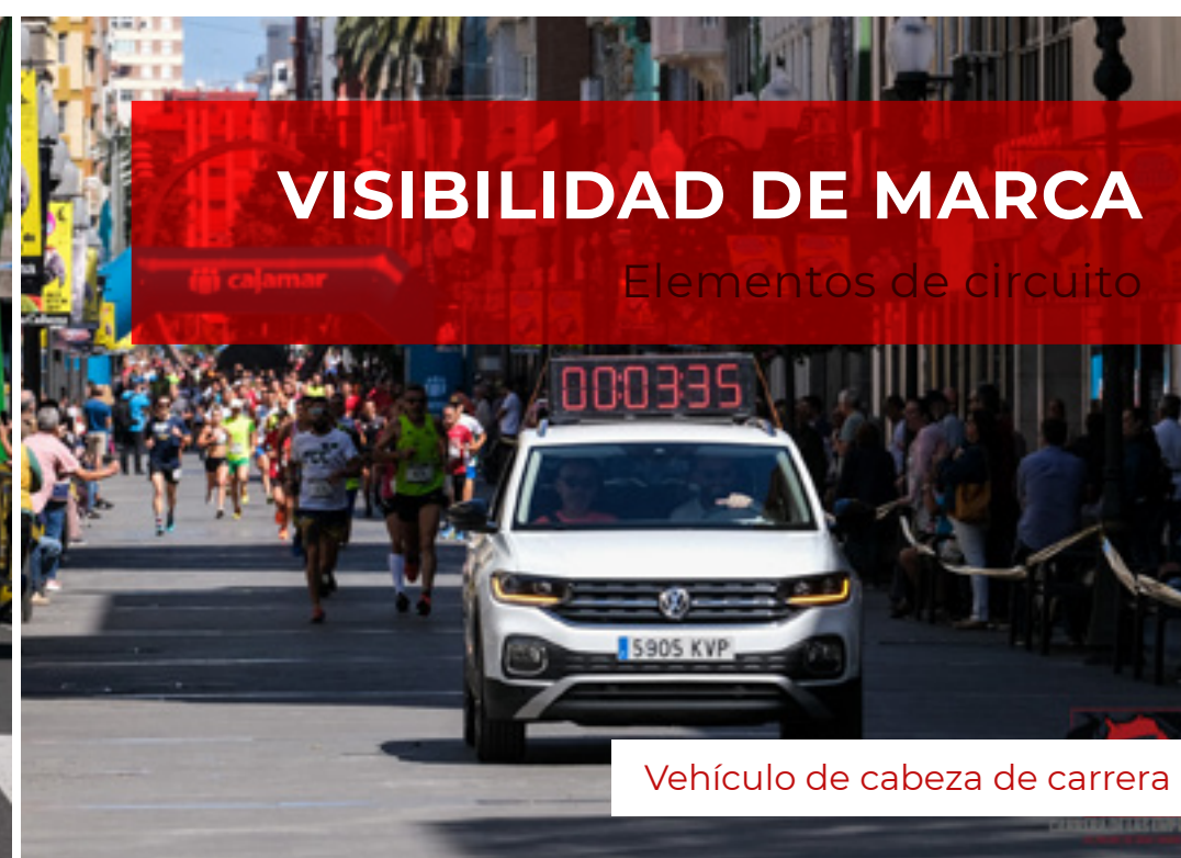
Vehículo de cabeza de carrera