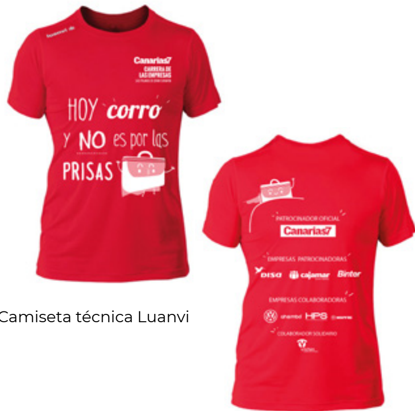
Camiseta técnica Luanvi