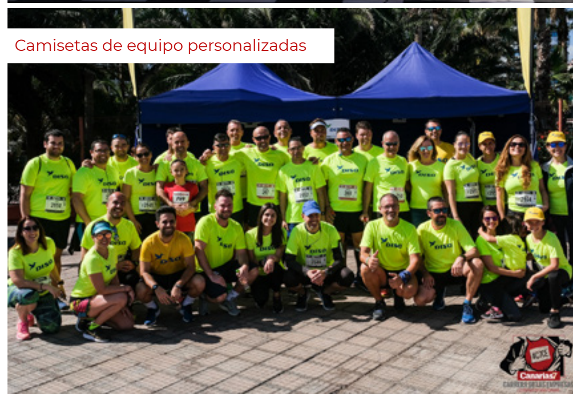
Camisetas de equipo personalizadas