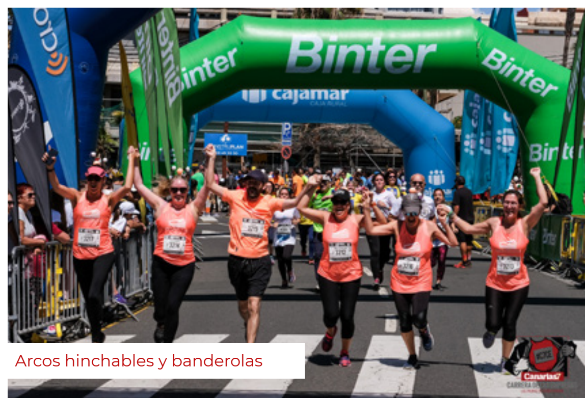
Arcos hinchables y banderolas